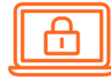
DENIAL OF SERVICE (DOS)